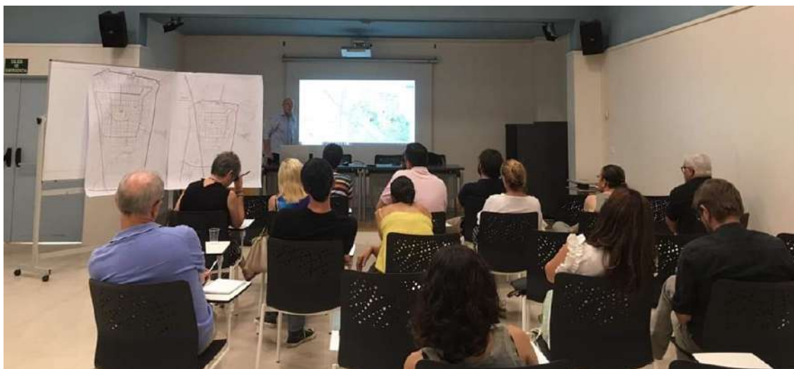
Presentació a l'Ajuntament