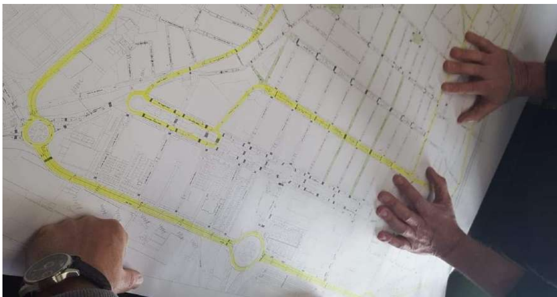
Treball amb tècnics d'Urbanisme