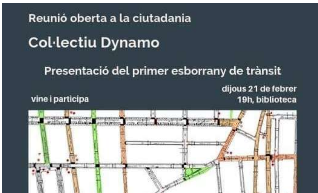
Anunci presentació primer esborrany