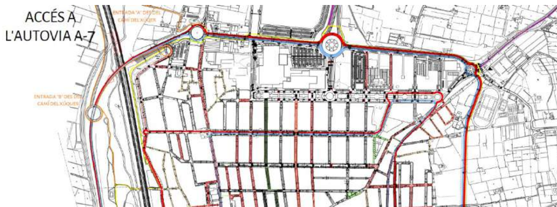
Ronda exterior Nord